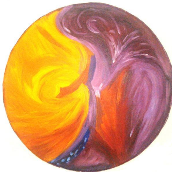
Mijn eerste oceandream

Kosten: 75,- inclusief materiaal, koffie, thee en lunch.